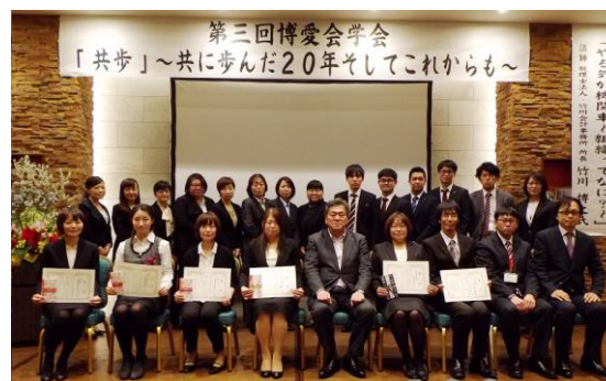
発表者(受賞者)記念撮影

ヴィラの幸田職員は、「スタッフが協力してチームアプローチをすることによる、経管栄養から経口摂取に移行した事例報告」をしました。これからもサービスの向上に向けて、日々研鑽して参ります。同時に開かれた「事業所ポスターコンクール」では、残念ながら入賞は逃すも、ヴィラから2作品を出品、次回は入賞を目指します。