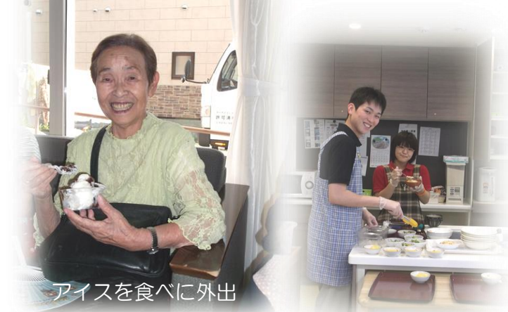
アイスを食べに外出

「半年前に比べて固いものが食べにくくなった」「お茶や汁物でムセ込みが多くなった」「口の渇きが気になる」などの心配や心当たりのある方も、ぜひご相談ください。