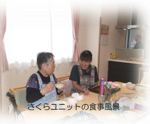
さくらユニットの食事風景

7月より当施設の協力歯科医療機関であります「つがやす歯科医院」の歯科医師又は歯科医師の指示を受けた歯科衛生士より、介護職員に口腔ケアに関するアドバイスや指示をいただいております。これに伴い「口腔機能維持管理体制加算」（自己負担：1月30円）が算定されます。この加算は施設の体制に対しての加算となるためすべての入所者様が対象となります。