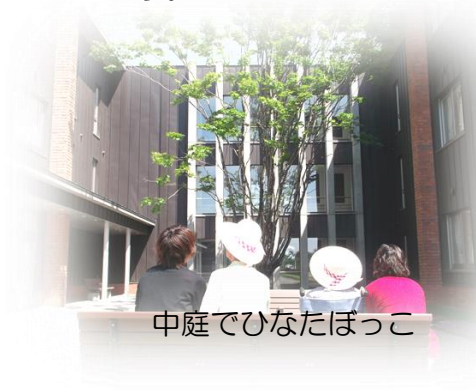
中庭でひなたぼっこ

利用者様ひとり一人の基本サービス費に各種加算を加えた1月あたりの総単位数に入所サービス利用者は1.5、通所利用者は1.7を乗じた単位数を算定させていただくこととなります。介護職員だけでなくヴィラかいせいスタッフ全員がより良いサービスを提供できるよう今後とも努力してまいります。どうぞよろしくお願いいたします。